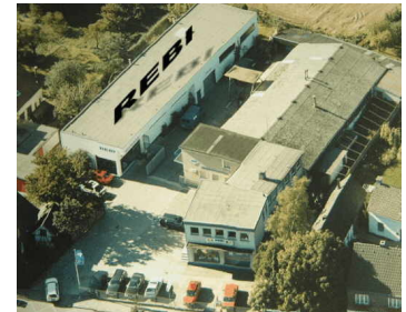
Firmensitz in Solingen