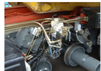
Einsatzgebiet Hydraulik bei Nutzfahrzeugen